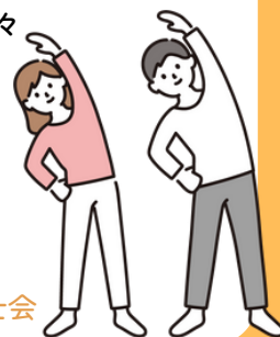
群馬県言語聴覚士会