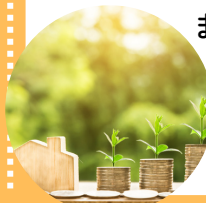
群馬県介護支援専門員協会高崎安中支部

また、その他介護保険で利用できるサービスなどについて表やイラストを使って解りやすくお伝えします。