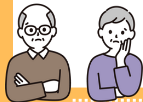
群馬県社会福祉士会

自宅で医療を受けるなら、どのような医療制度があるの？お金はどれくらいかかるの？こんな不安や疑問に答えるため、今回は、在宅生活で利用できる医療サービスなどについて表やイラストを使って解りやすくお伝えします。