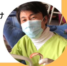
高崎市歯科医師会